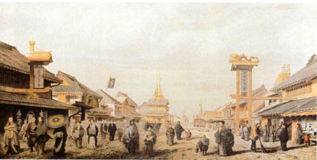
アルベルト・ベック「オイレブルク遠征図録」 「江戸 日本橋付近」複製画(部分) 天理大学附属天理図書館蔵