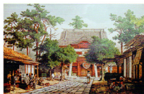
アルベルト・ベルク「江戸 神田明神」複製画(部分)