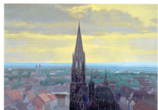
東山魁夷「晩鐘」リトグラフ