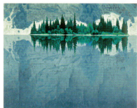
東山魁夷「みづづみ」リトグラフ