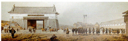
アルベルト・ベルク「江戸 江戸城の城壁と北門」複製画(部分)